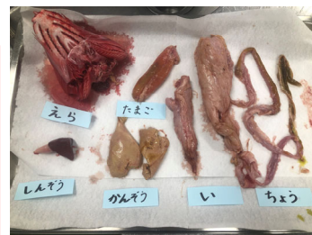
魚の顔や内臓見ました。

ぶりの実演の時に必ず話しをすることは、私たちが生きていくためには魚、肉、野菜の命を頂いて大きくなっていること、大切な命を頂いているのだから、嫌いなものでも無駄にせず一口でも頑張って食べてもらいたいという話をします。