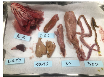
魚の顔や内臓見ました。

ぶりの実演の時に必ず話しをすることは、私たちが生きていくためには魚、肉、野菜の命を頂いて大きくなっていること、大切な命を頂いているのだから、嫌いなものでも無駄にせず一口でも頑張って食べてもらいたいという話をします。